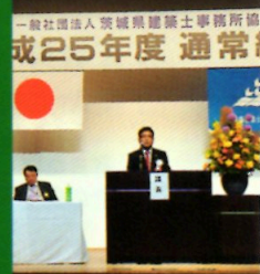
平成25年度通常総会