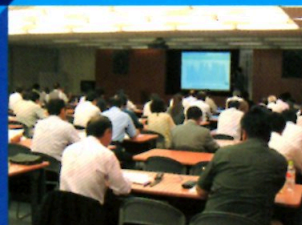
茨城県建築関連団体交流会