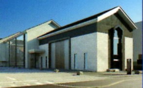
「第26回茨城建築文化賞」最優秀賞