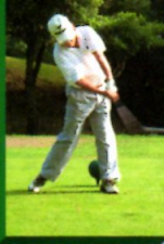
会員親睦ゴルフ大会