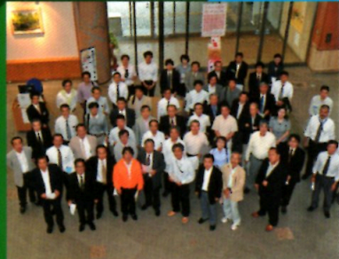
建築士事務所キャンペーン