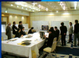
「第26回茨城建築文化賞」審査