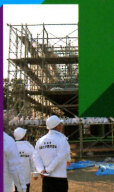
弘道館修復現場見学

約500の建築士事務所(正会員)と約150の関連企業(賛助会員)が、あなたの参加を待っています！