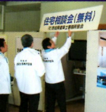
建築士事務所キャンペーン

一般社団法人茨城県建築士事務所協会は、建築士事務所の業務の適正な運営を確保するとともに、建築設計・工事監理業務の進歩改善と品位の保持向上、及び設計等を委託する建築主の利益の保護を図り、建築文化の向上と発展に努め、もって公共の福祉の増進に寄与することを目的とした一般社団法人です。