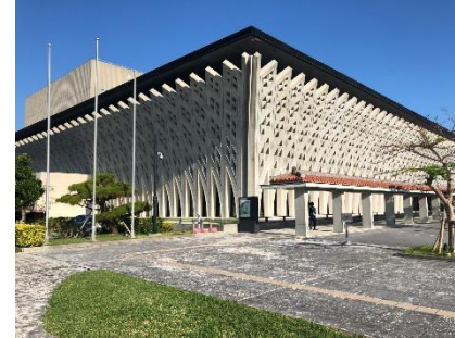
国立劇場おきなわ