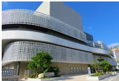
那覇文化芸術劇場 なはーと