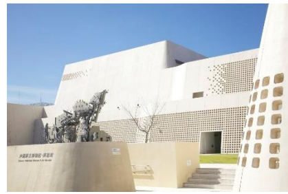
沖縄県立美術館・博物館